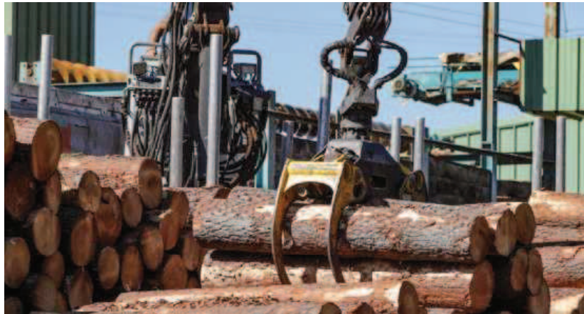
L'Amaf défend sa forêt de production qui pourrait être menacée par la réalisation du champ captant des Landes du Médoc.

Avec tous ces forages prévus dans la nappe profonde (oligo-cène), nous craignons que la nappe d'eau de surface subisse un effet et soit affectée par un abaissement significatif. Ce qui aurait pour conséquence de fra-